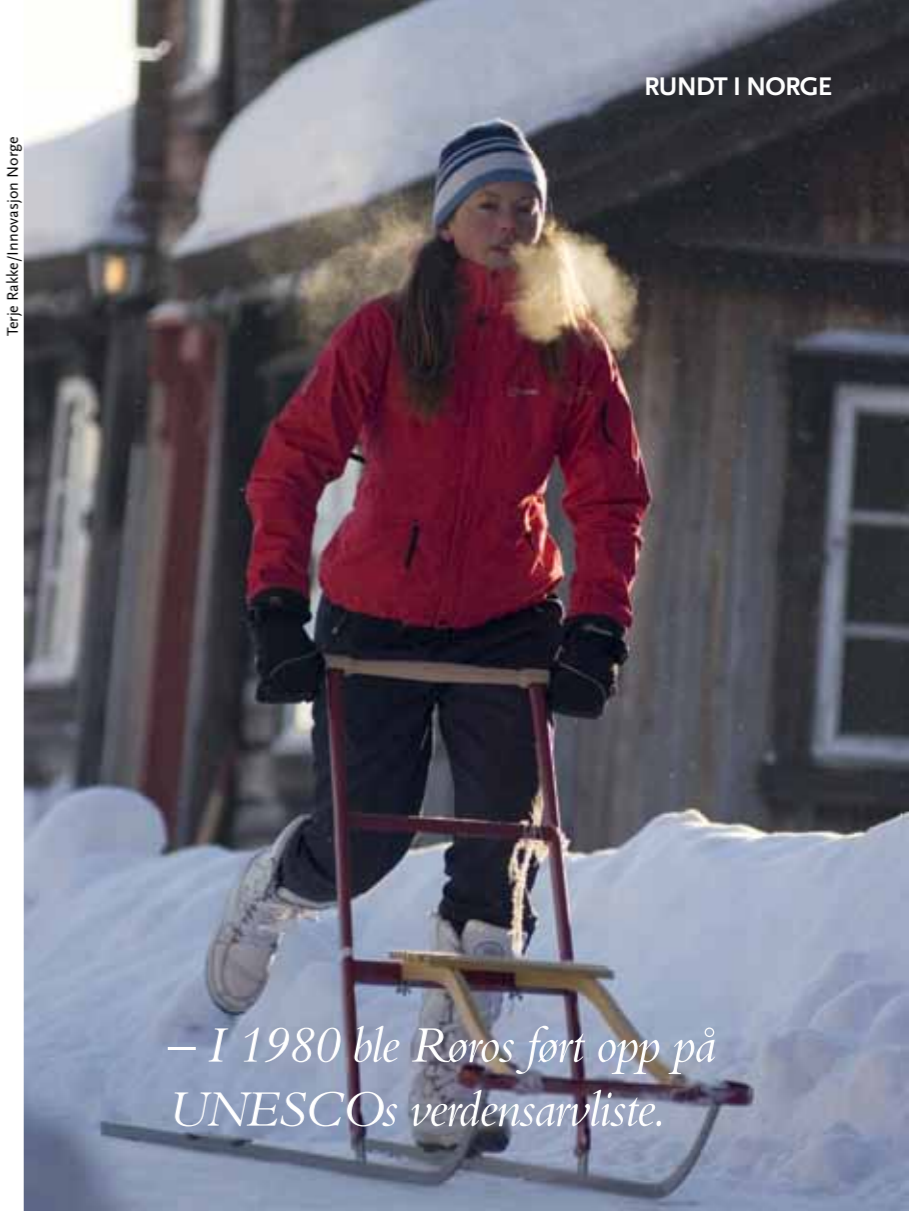
– I 1980 ble Røros ført opp på UNESCOs verdensarvliste.

HYGGELIG VERTSKAP. I byen bor du best på Røros Hotell eller det mindre og svært hyggelige ErzscheiderGården, som er nærmeste nabo til kirken. Ikke la det vanskelige navnet hindre deg. Erzscheider er tysk for malmskiller, og gården har røtter helt tilbake til 1600-tallet. I dag drives den