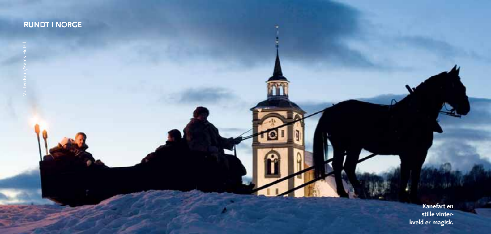
Kanefart en stille vinterkveld er magisk.